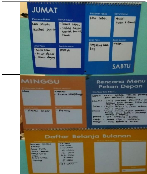
Gambar 1. Isian Health Reminder

Di dalam HR juga diberikan tempat untuk menghitung besaran pengeluaran keluarga agar kemampuan mereka melakukan manajemen keuangan keluarga meningkat (Machdum, Ramzy, Agus, & Annisah, 2019).